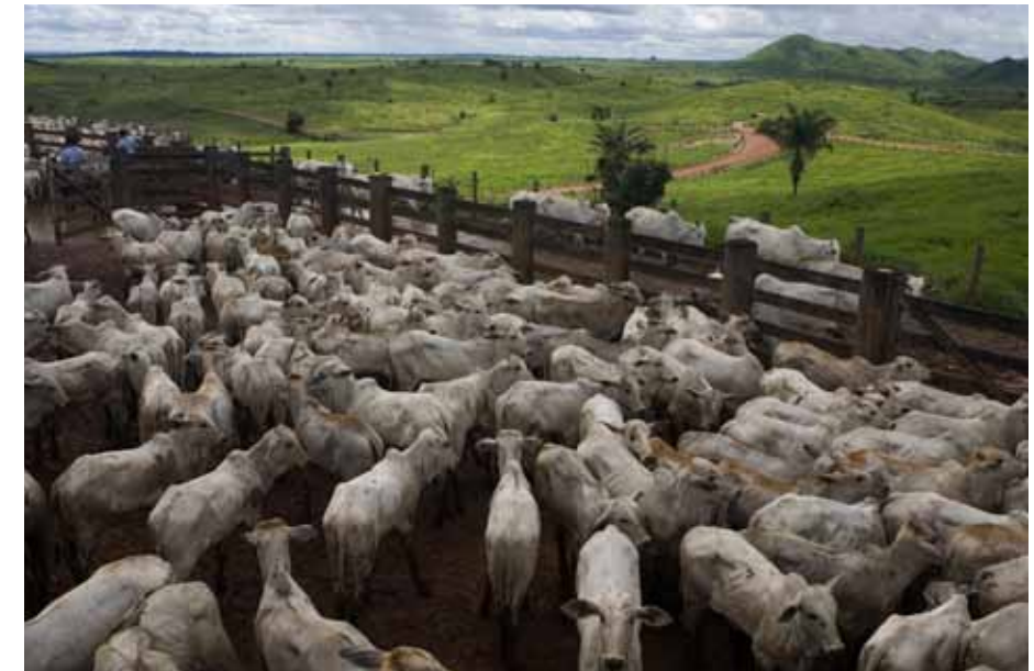
In Argentinien wird Urwald abgeholzt, um Weideland für Rinder zu gewinnen.

Die industrialisierte Landwirtschaft zerstört die Artenvielfalt. In der Intensivhaltung selbst kommen nur wenige Zuchtrassen zum Einsatz. Viele regionale Rassen sind inzwischen ausgestorben oder extrem gefährdet, weil nur noch hochproduktive Rassen gehalten werden. Laut FAO ist ein Fünftel aller Nutztierarten vom Aussterben bedroht. Der Futtermittelanbau in Monokulturen mit hohem Pestizideinsatz trägt ebenfalls zur Artenvernichtung bei: Hecken und Feldränder verschwinden, die chemi-