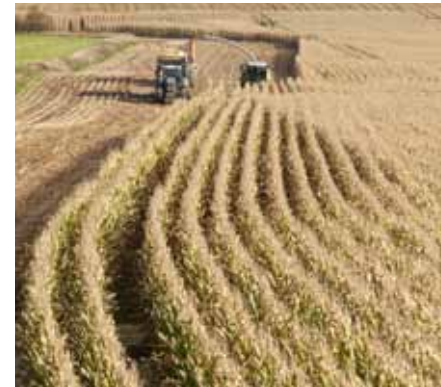
Auf 60 Prozent der deutschen Ackerfläche werden Futtermittel angebaut.

In Deutschland belegen allein Futtermittel 60 Prozent der Ackerfläche. Gleichzeitig gibt es eine Konkurrenz mit weite-