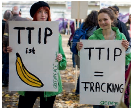
Protest gegen das Freihandelsabkommen in Wuppertal

Die Debatte zu den Auswirkungen von Freihandelsabkommen ist nicht neu, aber sie hat durch die aktuellen TTIP-Verhandlungen der Europäischen Union mit den USA eine neue Brisanz erhalten. Die Verhandlungen finden im Geheimen statt, und die nationalen Parlamente und die Bevölkerung werden nicht beteiligt. Sollte TTIP beschlossen werden, stehen wichtige ökologische, soziale und kulturelle Standards auf dem Spiel.